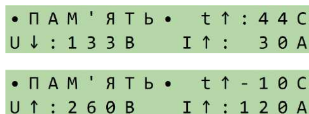
Рис.2 – Режим відображення зафіксованих основних значень

На передній панелі стабілізатора також розташовується кнопка перемикач режимів відображення індикатора. При короткочасному натисканні на кнопку індикатор переходить в режим #2: відображення зафіксованих основних значень (див. рис.2):